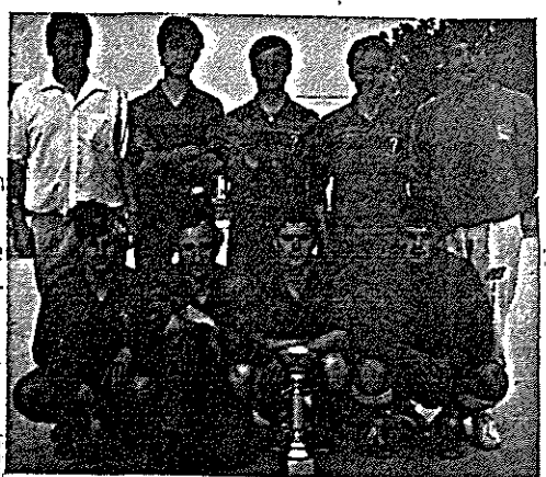
ANONIMS, DOMINEN LA LLIGA D'HIVERN 86-87